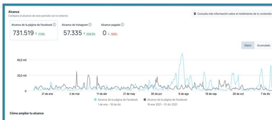
Gráfico Nro 1: Sobre los usuarios alcanzados en Facebook e Instagram, datos comparados del 2021 frente a los del 2022