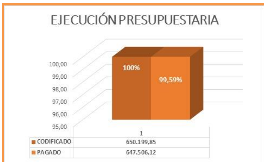
Gráfico Nro 3: Ejecución presupuestaria (Elaboración propia).